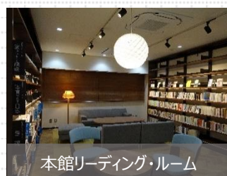
本館リーディング・ルーム