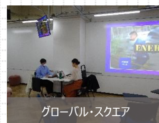
グローバル・スクエア