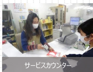
サービスカウンター