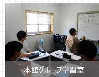
本館グループ学習室