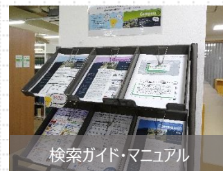
検索ガイド・マニュアル