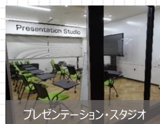
プレゼンテーション・スタジオ