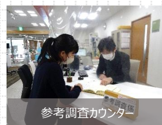
参考調査カウンター