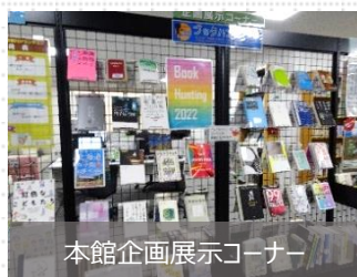
本館企画展示コーナー