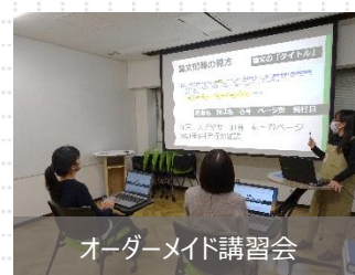
オーダーメイド講習会