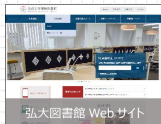
弘大図書館 Web サイト