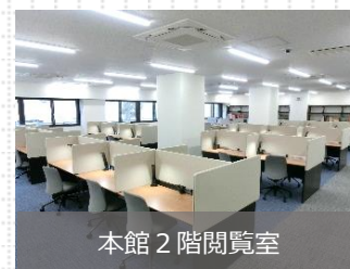
本館 2 階閲覧室