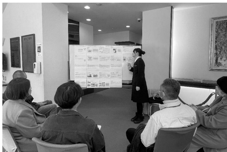
高校生のポスターセッション