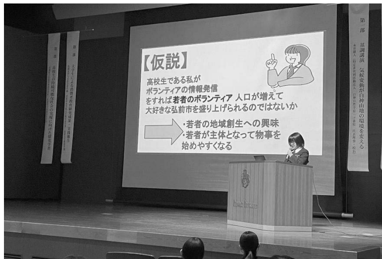
高校生の報告「多くの高校生が気軽にボランティアに参加できる環境づくりをするには」