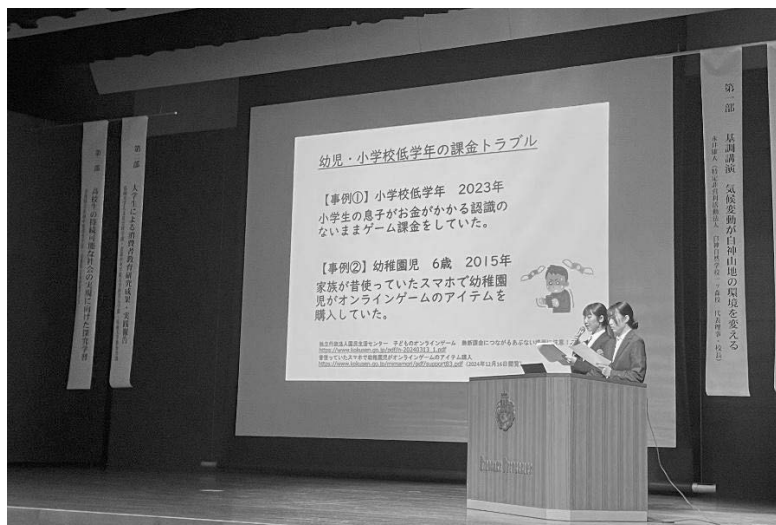
大学生の報告「デジタル社会における幼い子どもへの消費者教育」