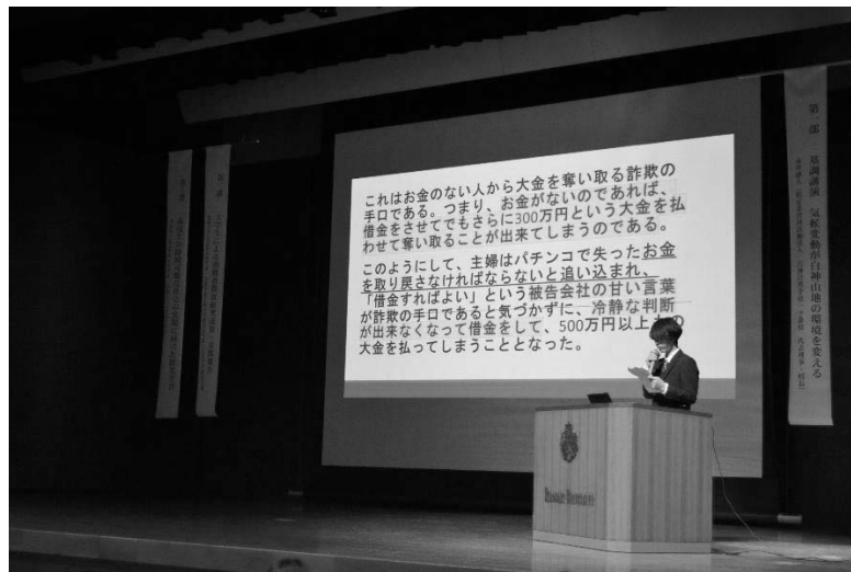
大学生の報告「専業主婦から500万円を騙し取った巧妙な詐欺の手口」