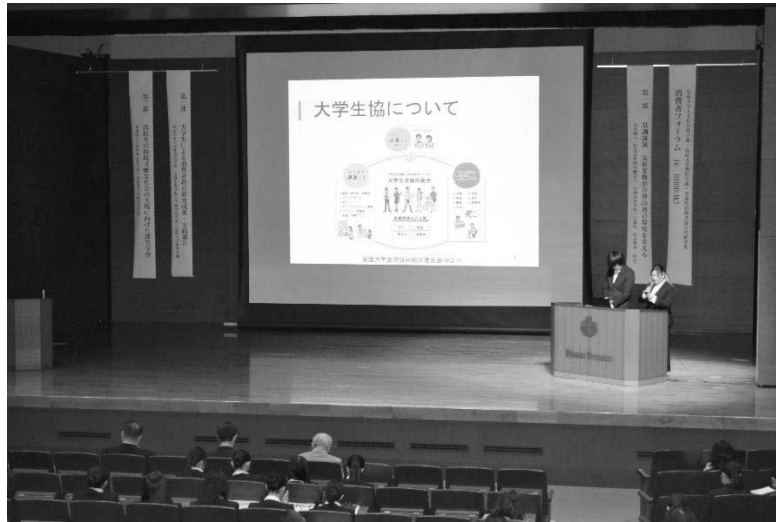
大学生の報告「大学生協の課題～消費者問題の視点から～」