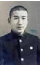
国立弘前高等学校入学当時の太宰治