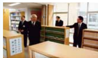
文庫・新書コーナー