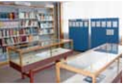
太宰資料の展示コーナー(右) 自筆ノート(下)