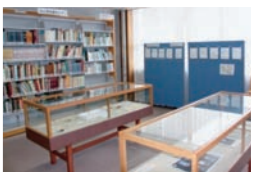
太宰資料の 展示コーナー(右) 自筆ノート(下)