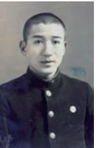
国立弘前高等学校 入学当時の太宰治