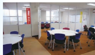
ラーニングスペース・スクエア