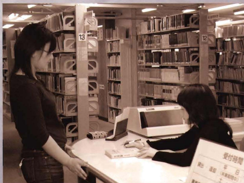
附属図書館 本館カウンター