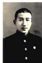
官立弘前高等学校 入学当時の太宰治

本学名誉教授松木明知氏から寄贈されたウィリアム・オスラーコレクション(115冊、別刷95点)、医学古典叢書の復刻版(44冊)、レオナルド・ダ・ヴィンチコレクション(20冊)及びノーベル医学・生理学賞関連コレクション144冊(平成14年度大型コレクション採択分143冊、松木明知氏寄贈1冊)からなる文庫です。