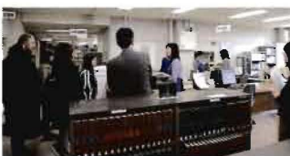
留学生ガイダンス