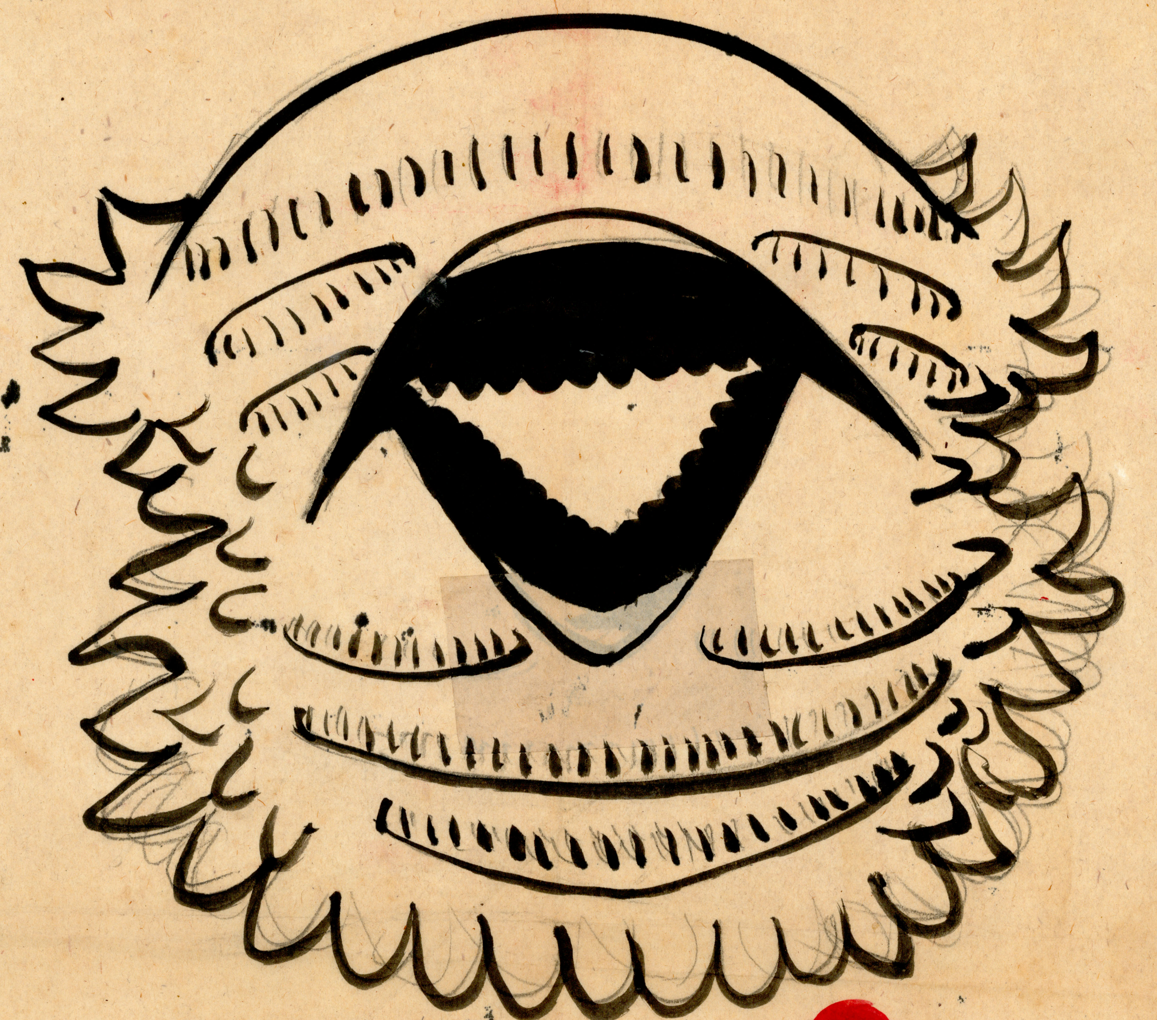
ニホンアカガヘル