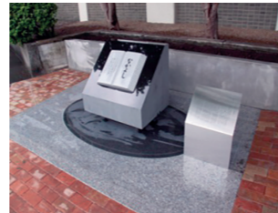
加藤謙一記念碑「なかよし」