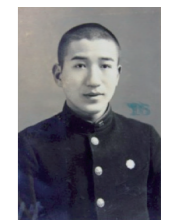
国立弘前高等学校入学当時の太宰治