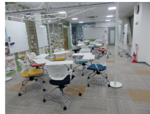
2階アクティブ・ラーニング・エリア