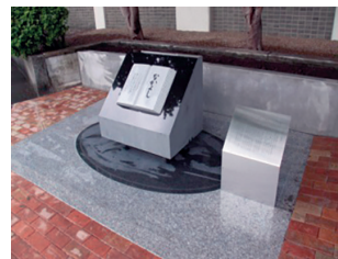
加藤謙一記念碑「なかよし」