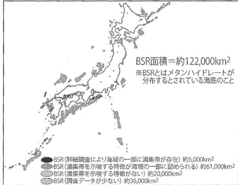
図 2-103 メタンハイドレート埋蔵分布図 (2009年)