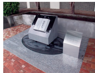
加藤謙一記念碑「なかよし」